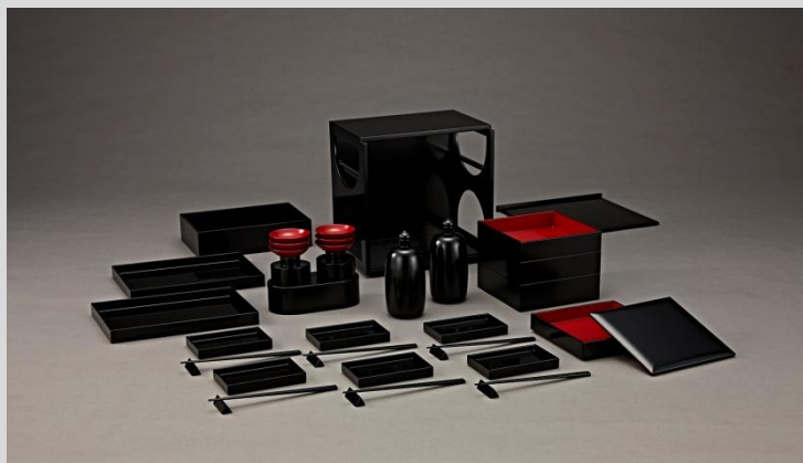
輪島塗 (わじまぬり)