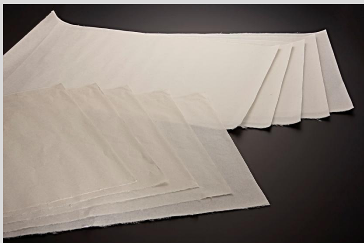
石州半紙 (せきしゅうばんし)