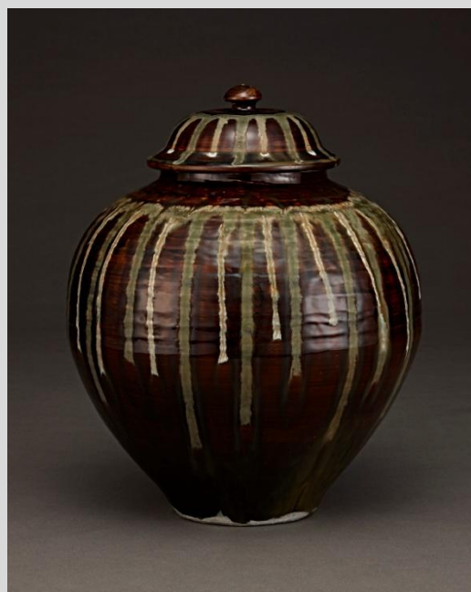
小鹿田焼 (おんたやき)