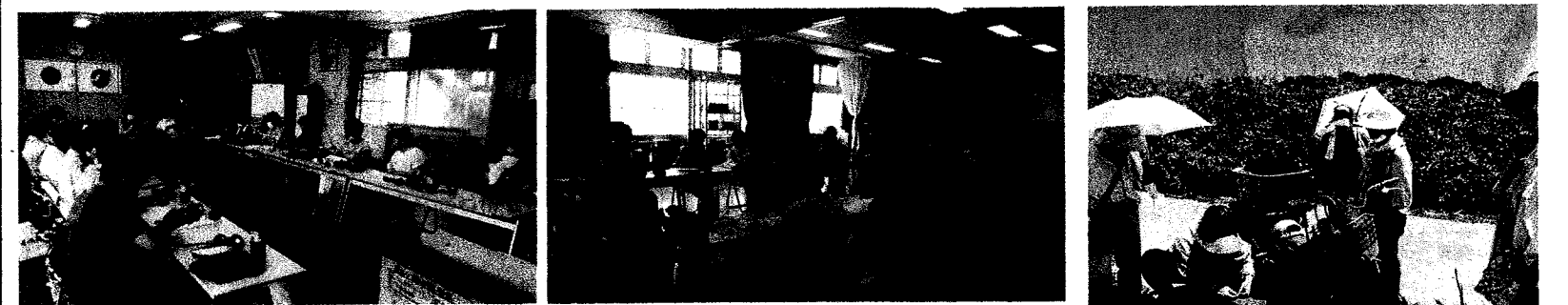
敬老会メッセージカード作り

暑い中たくさんの方に来て頂いて、 仕上げてくれました。 忙しい中ありがとうございました!