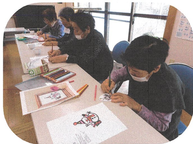
クリスマスの飾りを作りました♪