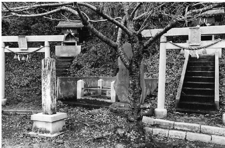
▲ 右が弁天社、左が金比羅社。その他、辰悦丸帰港の碑や歌会始めの預選歌碑などが建つ。

その視点から考えて「輪島」の「島」と何か関係が有るように思えない。輪島の現在の地形では「島」の感覚はないが、輪島町史の古代輪島の沖積過程想定図第一期では今の市街地のほとんどが海底であり、現