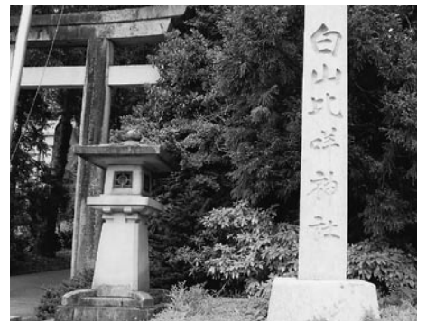
▲ 白山比咩神社社号碑

その時、富士通の役員の方から、明治時代に軍艦に漆を使用して日露戦争(一九〇四〜五)で大勝したとの話を聞きました。漆を何に使ったかを調べてみると、大砲の砲弾