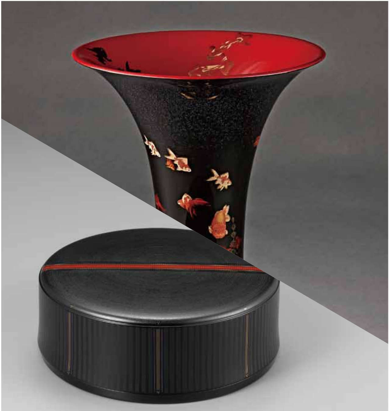
(上から) 藤野靖男《金魚蒔絵花器》2020年(個人蔵) / 山岸一男《沈黒象嵌合子「能登残照」》2016年(東京国立近代美術館蔵) *いずれも部分