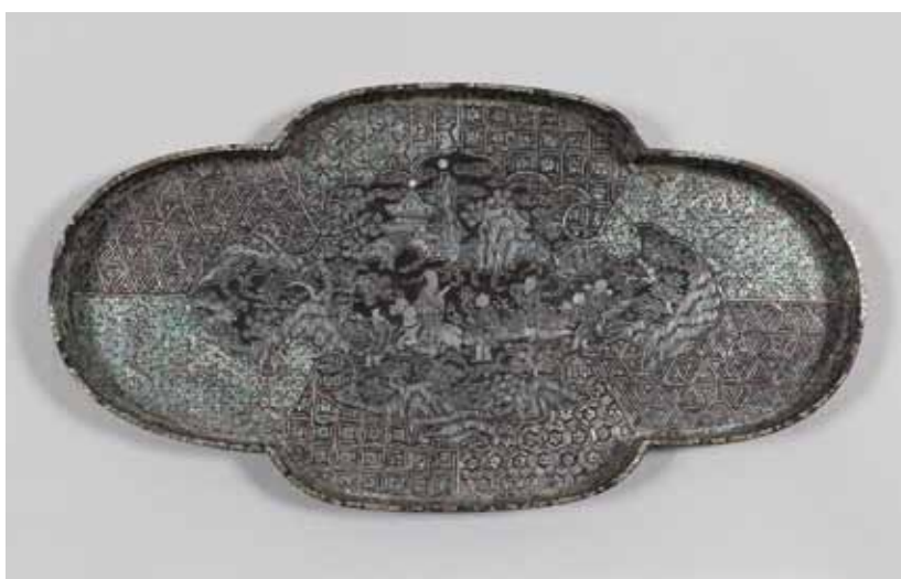
《唐物螺鈿木瓜形盆》中国・明時代

を配し、全てが小さく貼り並べられた薄貝によって表現されています。窓の周縁は8つの枠に区切ったうえ、七宝・亀甲・麻葉文などで埋め尽くされています。請来文物と呼ばれる海外からもたらされた品々の一例と言え、絢爛な裝飾と精細な技巧を楽しむことのできる優品です。