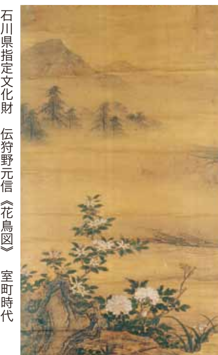
石川県指定文化財 伝狩野元信《花鳥図》 室町時代

二幅からなる《花鳥図》は狩野派初期の特徴をよく表し、裝飾性豊かで温雅な色彩を帯びています。右隻は音を立てて流れるような溪流と険しい岩を技巧的な筆致であざやかに表現し、樹木、花々、遊禽を近景、遠景に所狭しと配しています。左隻にはかすみがる遠景を描き、広大な空間を感じさせています。さらに白で統一されたボタンの花々が清廉なたたずまいに添えられています。横へ広がりをもせる構図から、もとは襖絵であったものを掛幅に仕立てたものとの説があります。