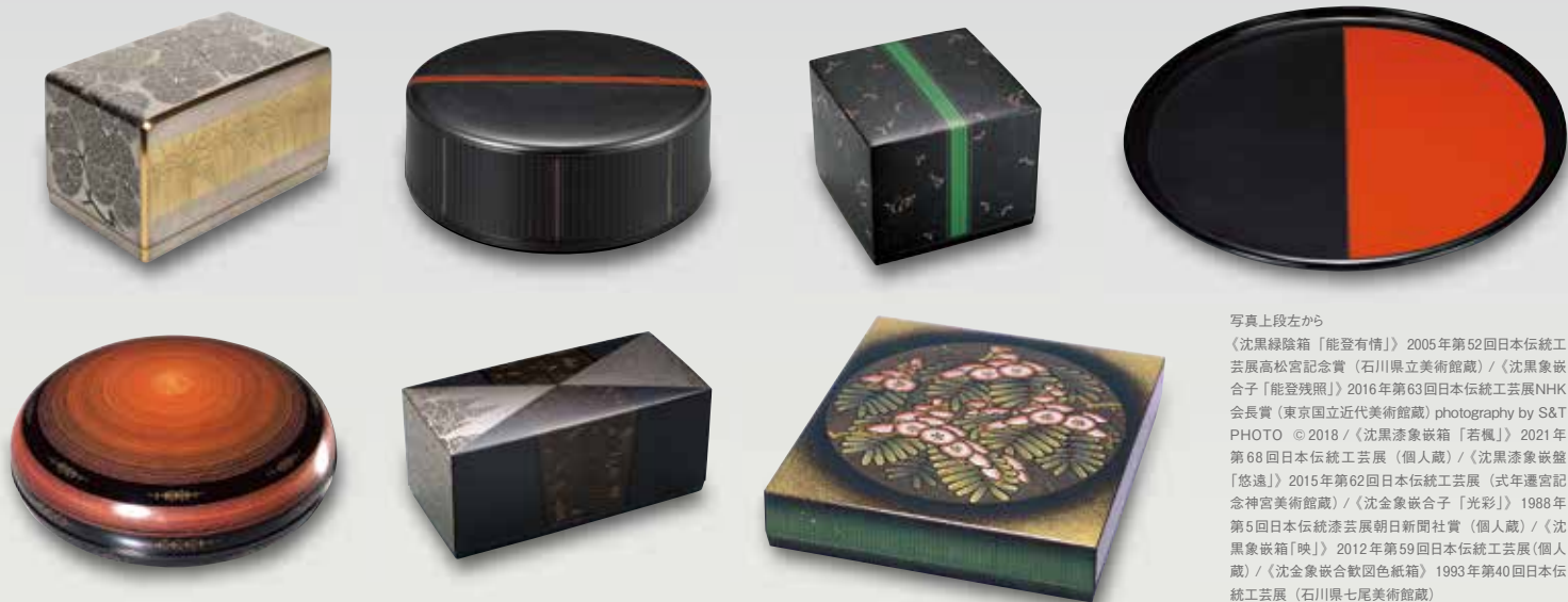
写真上段左から 《沈黒線陰箱「能登有情」》2005年第52回日本伝統工芸展高松宮記念賞(石川県立美術館蔵) / 《沈黒象嵌合子「能登残照」》2016年第63回日本伝統工芸展NHK会長賞(東京国立近代美術館蔵) / 《沈黒漆象嵌箱「若楓」》2021年第68回日本伝統工芸展(個人蔵) / 《沈黒漆象嵌盤「悠遠」》2015年第62回日本伝統工芸展(式年遷宮記念神宮美術館蔵) / 《沈金象嵌合子「光彩」》1988年第5回日本伝統漆芸展朝日新聞社賞(個人蔵) / 《沈黒象嵌箱「映」》2012年第59回日本伝統工芸展(個人蔵) / 《沈金象嵌嵌紙箱》1993年第40回日本伝統工芸展(石川県七尾美術館蔵)