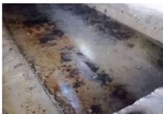
水が残って悪臭が発生する