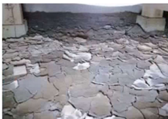
乾燥した汚泥も悪臭の原因に