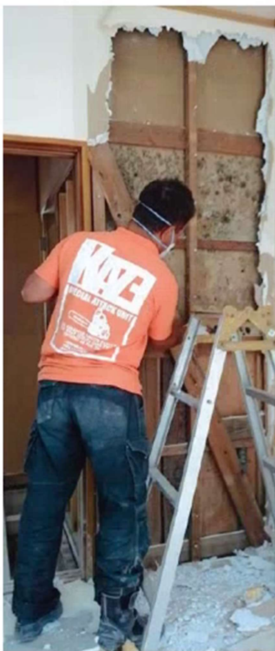
壁をはがすとカビが生えている