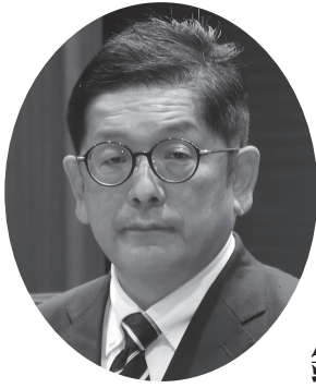
日本共産党 鏜 史朗 議員