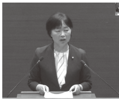
6月定例会での代表質問・一般質問の様子。