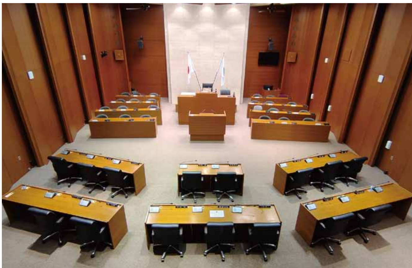
傍聴席から見た議場 傍聴席は手すりや車いす用の昇降機が設置されたバリアフリー仕様です

復旧復興の進捗状況や課題をより多くの皆様と共有することで、開かれた議会を目指してまいります。