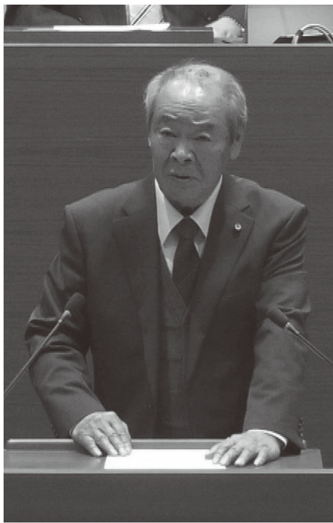
12月定例会での代表質問・一般質問の様子。計9名の