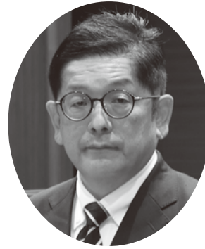
日本共産党 鑑 史朗 議員