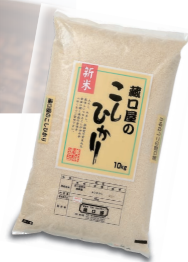
○こしひかり (精米) 10kg