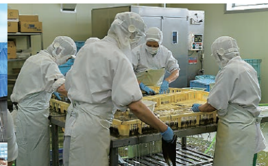
輪島港近くにある加工場。市内の港で水揚げされた魚の加工を行っている