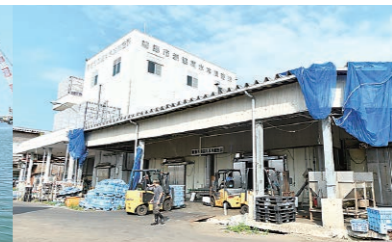
出漁や荷揚げ作業が可能になったことで、活気を取り戻しつつある