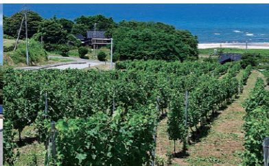
地震直後には再開は無理だと思われたぶどう畑も多くの人の手で復活