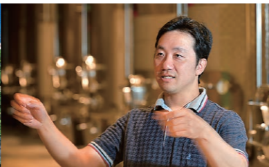
「この土地を離れる気持ちは微塵もない」と言い切る高作さん